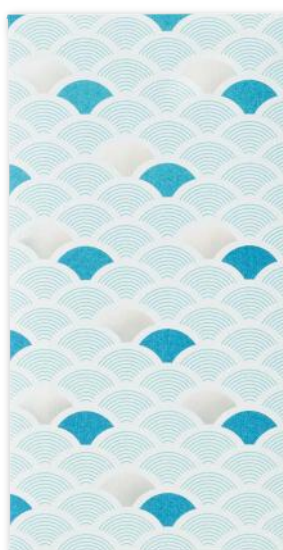
青海波 / SEIGAIHA

寄せては返す波が永遠に続くように 《未永く続く幸福と平和への願い》 が込められた縁起の良い模様です。