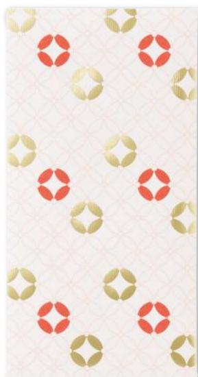
七宝 / SHIPPO

願いが込められた日本古来の伝統文様をアレンジしました。 シーンを選ばず幅広い用途でお使いいただけます。