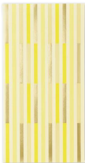
縞 / SHIMA

太い縞を親、細い縞を子に見立てて 《家内安全》や《子孫繁栄》の願いが 込められた模様です。江戸時代には 《粋》の象徴とされ流行しました。