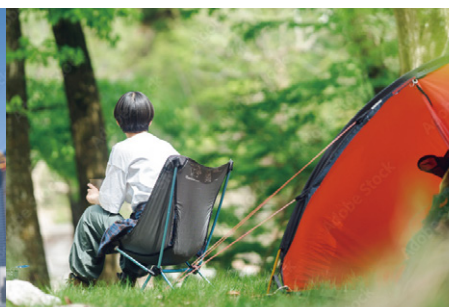
アウトドア・レジャー