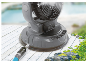
水道直結 水道からホースに繋いで給水 ※水道直結時はミストスイッチはOFF