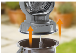
ポンプ バケツの水をポンプで給水