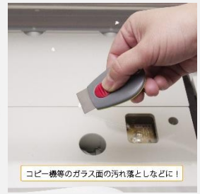
コピー機等のガラス面の汚れ落としなどに！