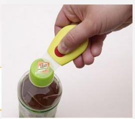
プラスチック面のシールはがしに！

イエロー側からはプラスチックヘラ、グレー側からはステンレス刃がワンタッチで出て、用途に合わせて使えます！